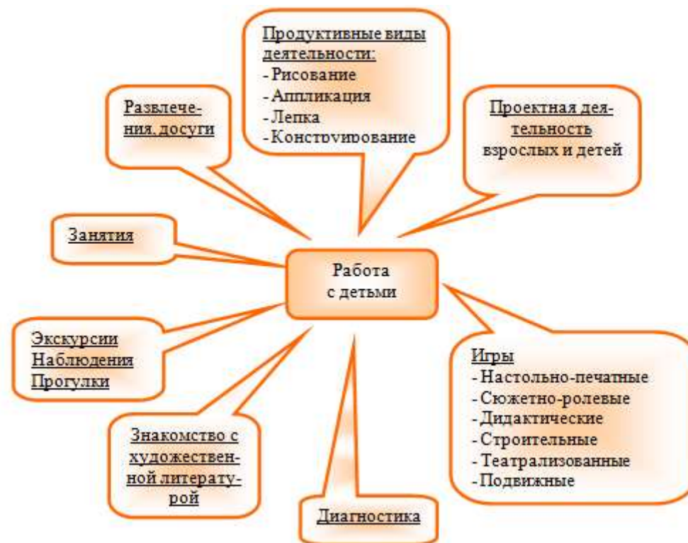
Рис.1 Формы работы с детьми по обучению безопасному поведению на дороге